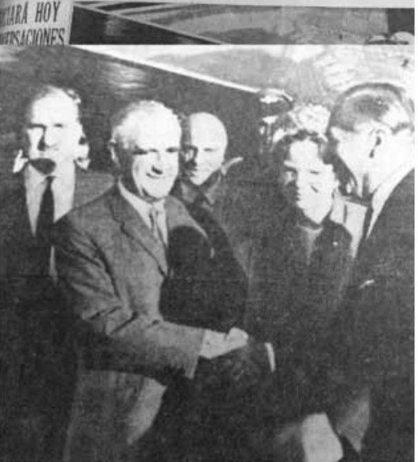
Finaliza su Visita el Canciller Británico