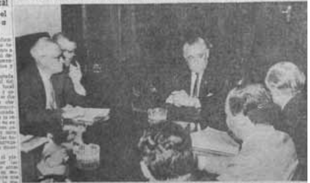
El canciller británico, Sr. Michael Stewart, se reunió con el ministro de Relaciones Exteriores de Argentina, Sr. Miguel Angel Zavala Ortiz, en un momento de la entrevista.