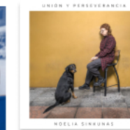
Unión y perseverancia 2025