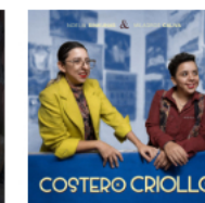
Costero Criollo 2025