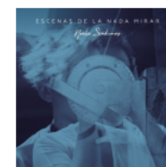
Escenas de la nada mirar 2018