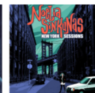
New York Sessions 2020