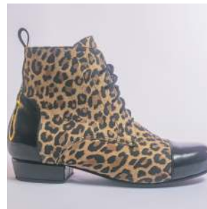
● nuevas botitas 3 cm