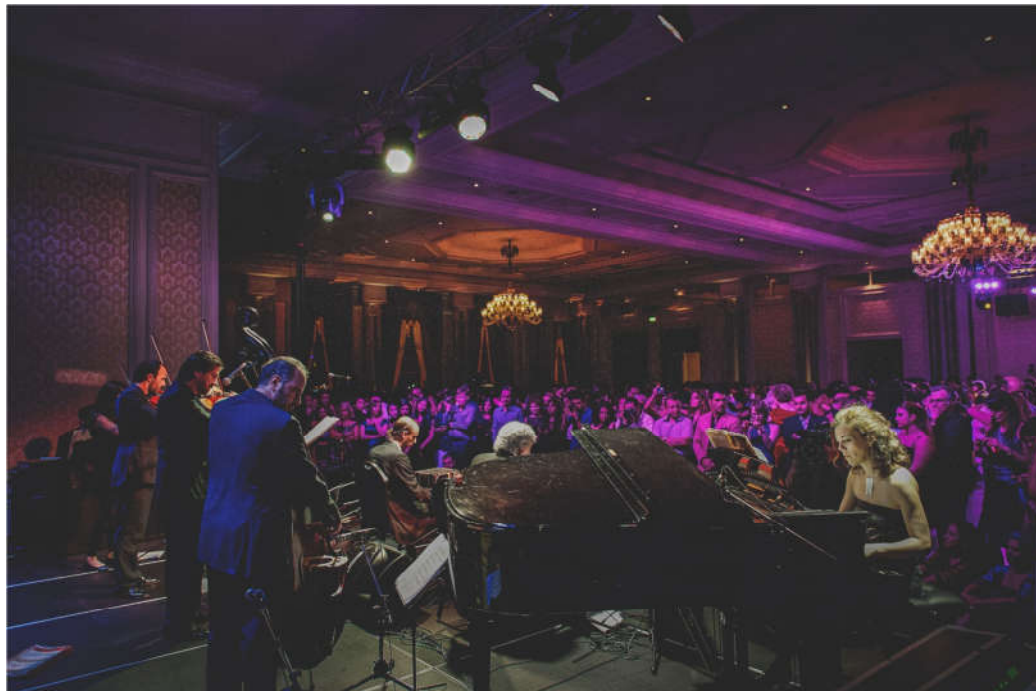
Festival "Tango to Istanbul", Turquía, 2013