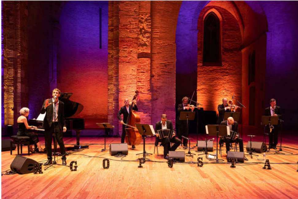
Festival Internacional Tangopostale, Toulouse, Francia, 2025