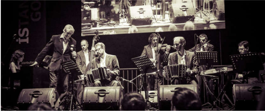
Wolkswagen Arena, Istanbul, Turquia, 2015