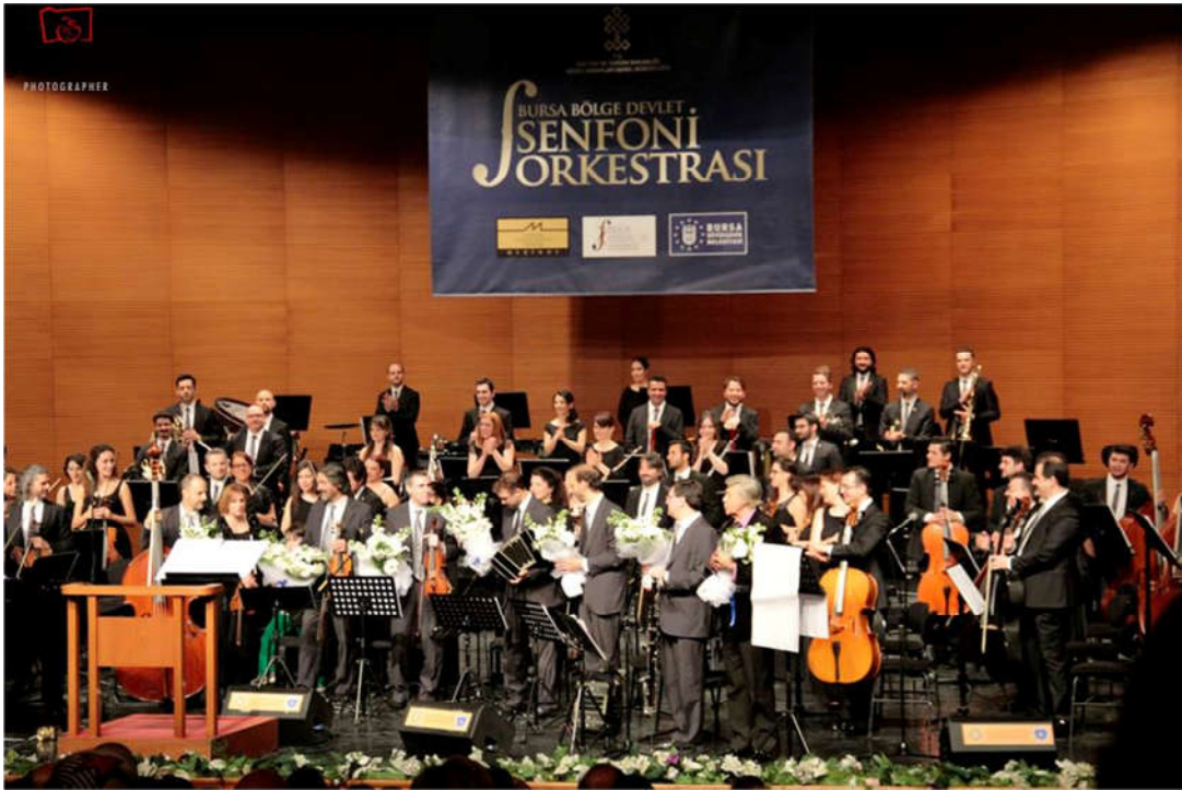
Con Orquesta Sinfónica de Bursa, Turquía, 2015