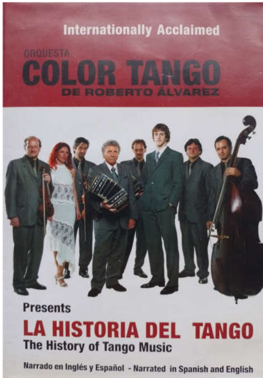
Dvd "La Historia del Tango", 2007