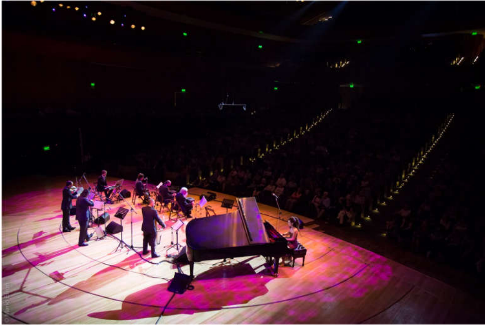
CCK, Buenos Aires, Argentina, 2016