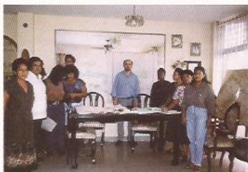
Vigilancia nutricional en madres embarazadas y niños menores de 5 años. Guayaquil, Ecuador.