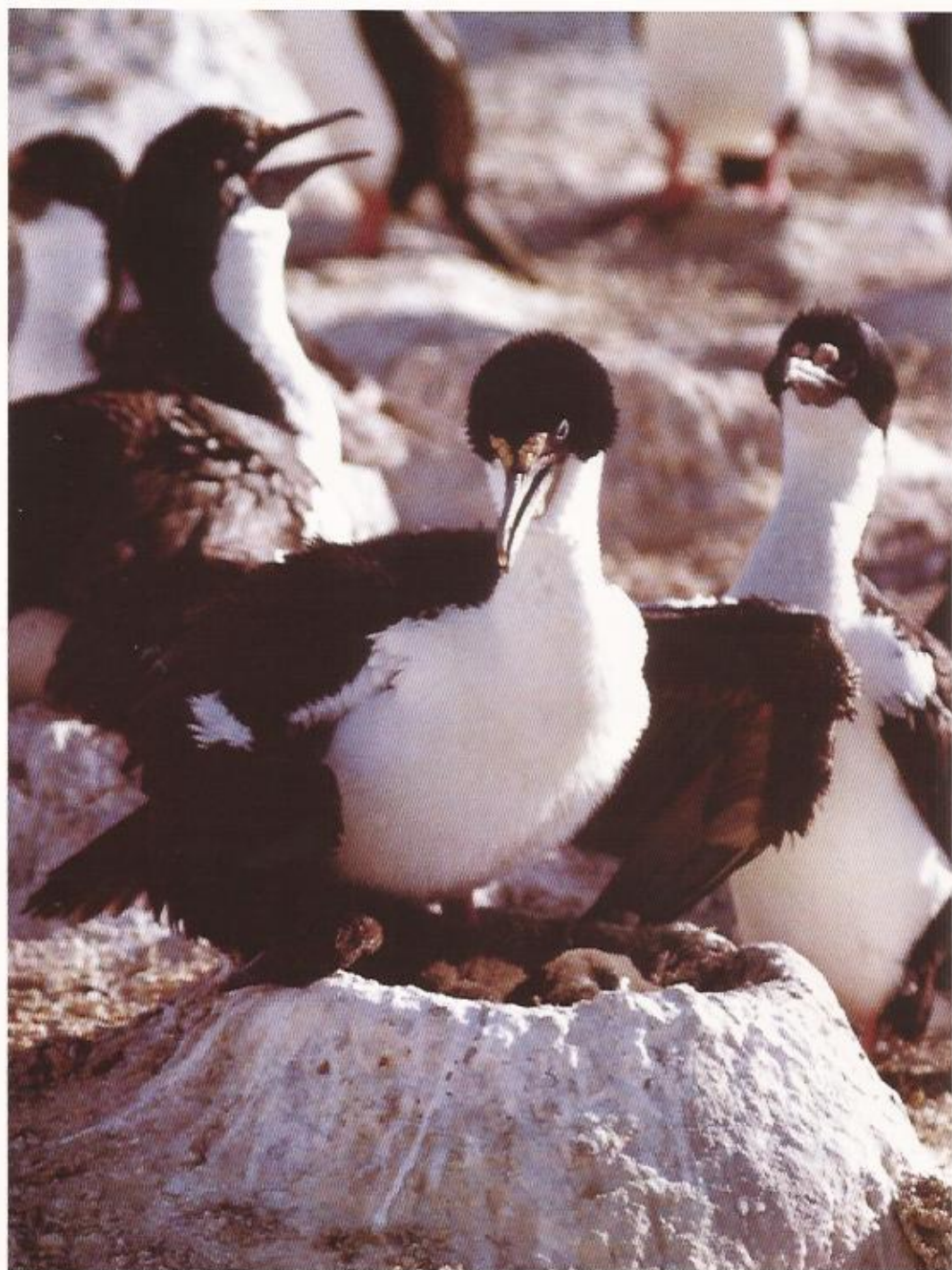
La solidaridad crea vida. Fondo Argentino de Cooperación Horizontal