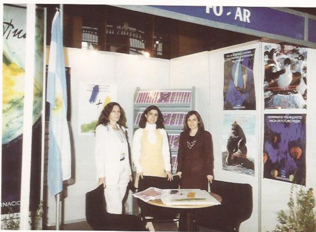
Stand FO-AR Exposición de Cooperación Internacional Santiago - Chile (1997)

b) Si las instituciones presentan proyectos similares o relacionados con los ejecutados con anterioridad en el marco del FO-AR, deberán acompañar la nueva solicitud con un informe de la cooperación ya recibida y una justificación del nuevo requerimiento.