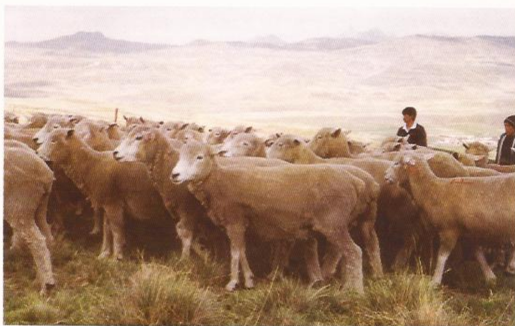
Perú: Ovejas Corriedale utilizadas en el desarrollo de pruebas de Progenie y en la formación de un Núcleo Reproductor de Ovino en la Sierra Central

En los últimos años me tocó cumplir dos misiones FO-AR para colaborar en el proyecto de mejoramiento genético de ovinos en la Sierra Central peruana, teniendo a profesionales de la Universidad Nacional Agraria La Molina de Lima como contraparte. Como especialista en el diseño y conducción de programas de mejoramiento genético y en mi función de Coordinador Nacional de Investigaciones en Rumiantes Menores (ovinos, caprinos y camélidos) del INTA tuve varias oportunidades de recorrer nuestro país y visitar otros. Si bien siempre he sido recibido cordialmente, en las misiones FO-AR se acentúa la vinculación de la persona con la nacionalidad: uno realmente se siente un "embajador" y, al mismo tiempo, es recibido como tal. En ese sentido, la experiencia recogida en el al-