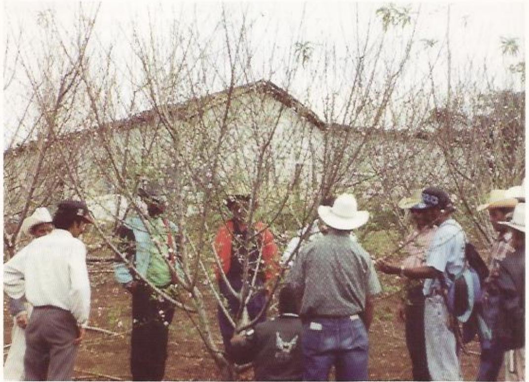
Capacitación en fruticultura. Jalapa, Guatemala

gia de Gestión para la Calidad de la Educación, y una conferencia magistral en el Simposio Internacional "La Descentralización: desafío para la calidad y la equidad de la Educación", actividades en las cuales demostró su gran capacidad, experiencia y preparación en el tema objeto de estudio, recibiendo encomiables muestras de reconocimiento.