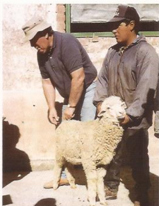
Izquierda: Inseminación laparoscópica con sémén congelado de carneros argentinos de alto valor genético (Sierra Central, Perú)