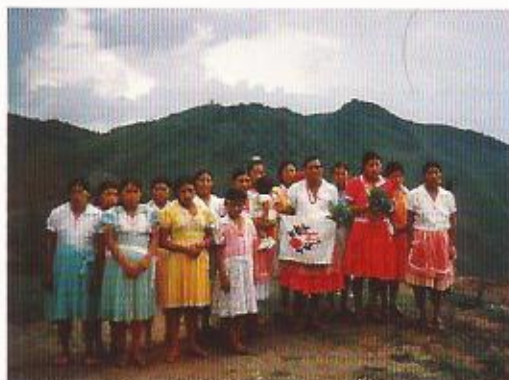
Proyecto 3038 / Guatemala "Capacitar y asesorar mujeres para fortalecer su habilidad en Proyectos Productivos" Grupo de mujeres Aldea El Guayalo Mayo - junio 1999

Guatemala 115 proyectos de cooperación, los cuales han beneficiado a 3848 personas. La propia Secretaría de Planificación y Programación de la Presidencia se honra con haber construido el salón de sesiones "Argentina", para coordinación interna y externa de instituciones relacionadas con la cooperación.